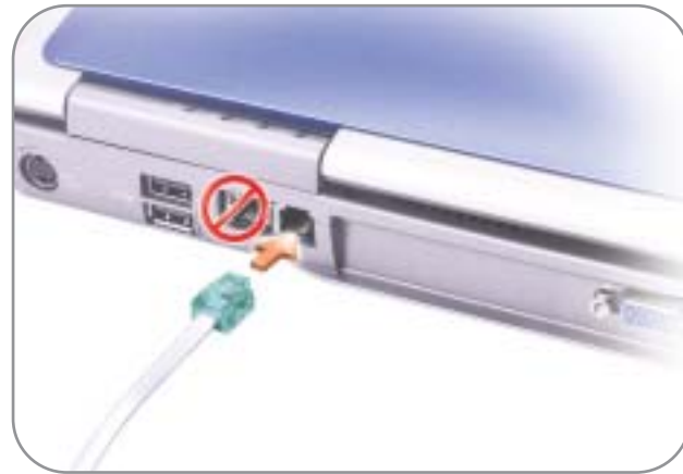
2 Modem 调制解调器 モデム