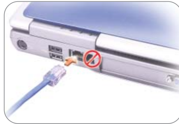
3 Network 网络 ネットワーク