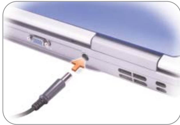
1 AC Adapter 交流适配器 AC アダプタ

Dell™ コンピュータをセットアップして使用する前に、『製品情報ガイド』の安全にお使いいただくための注意をよくお読みください。詳細な機能の一覧についても『オーナーズマニュアル』を参照してください。