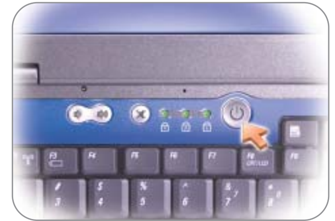
4 Power Button 电源按钮 電源ボタン